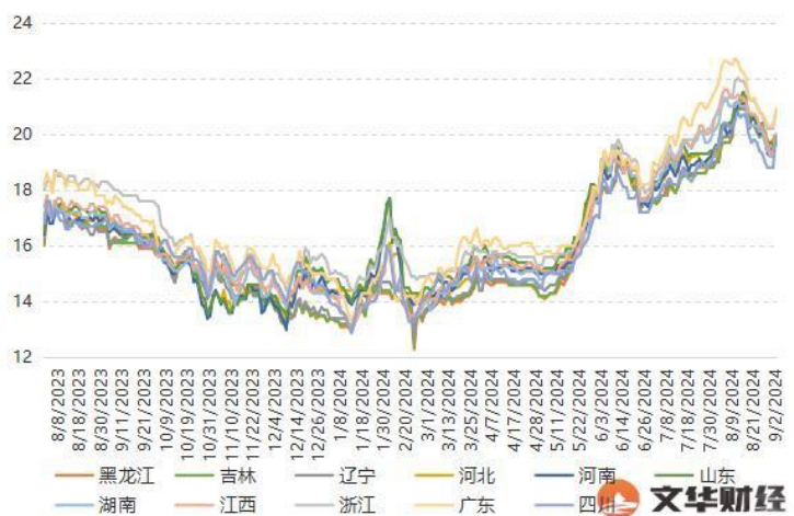
国内生猪现货(元/公斤)