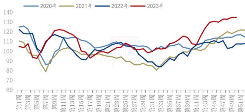
全国玉米深加工周度消耗量(单位: 万吨)

2、据 Mysteel 农产品统计，2023 年 50 周（12 月 7 日-12 月 13 日），全国主要 126 家玉米深加工企业（含淀粉、酒精及氨基酸企业）共消费玉米 134.95 万吨，较前一周增加 0.13 万吨；与去年同比增加 27.6 万吨，增幅 25.69%。