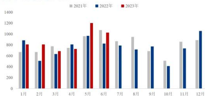
中国进口大豆分月走势 (万吨)

4、海关总署近日发布的数据显示，2023 年 1-6 月累计进口量为 5257.90 万吨，较去年同期的 4628.5 万吨增加 629.4 万吨，或同比增幅 13.60%。2023 年 6 月，中国大豆进口量为 1027 万吨，较 2022 年 6 月 825 万吨增加 202 万吨，或同比增幅 24.48%，较 5 月份 1202 万吨减少 175 万吨，或环比降幅 14.55% 。