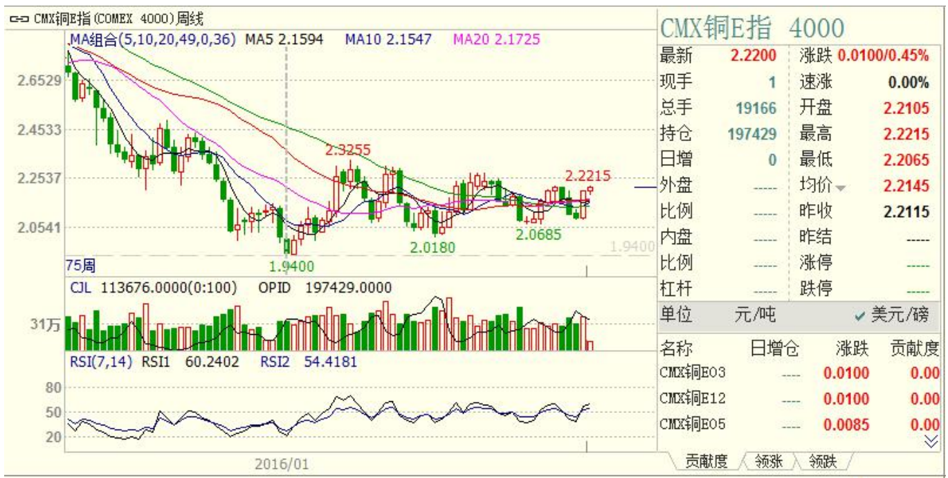
CMX 铜指周 k 线