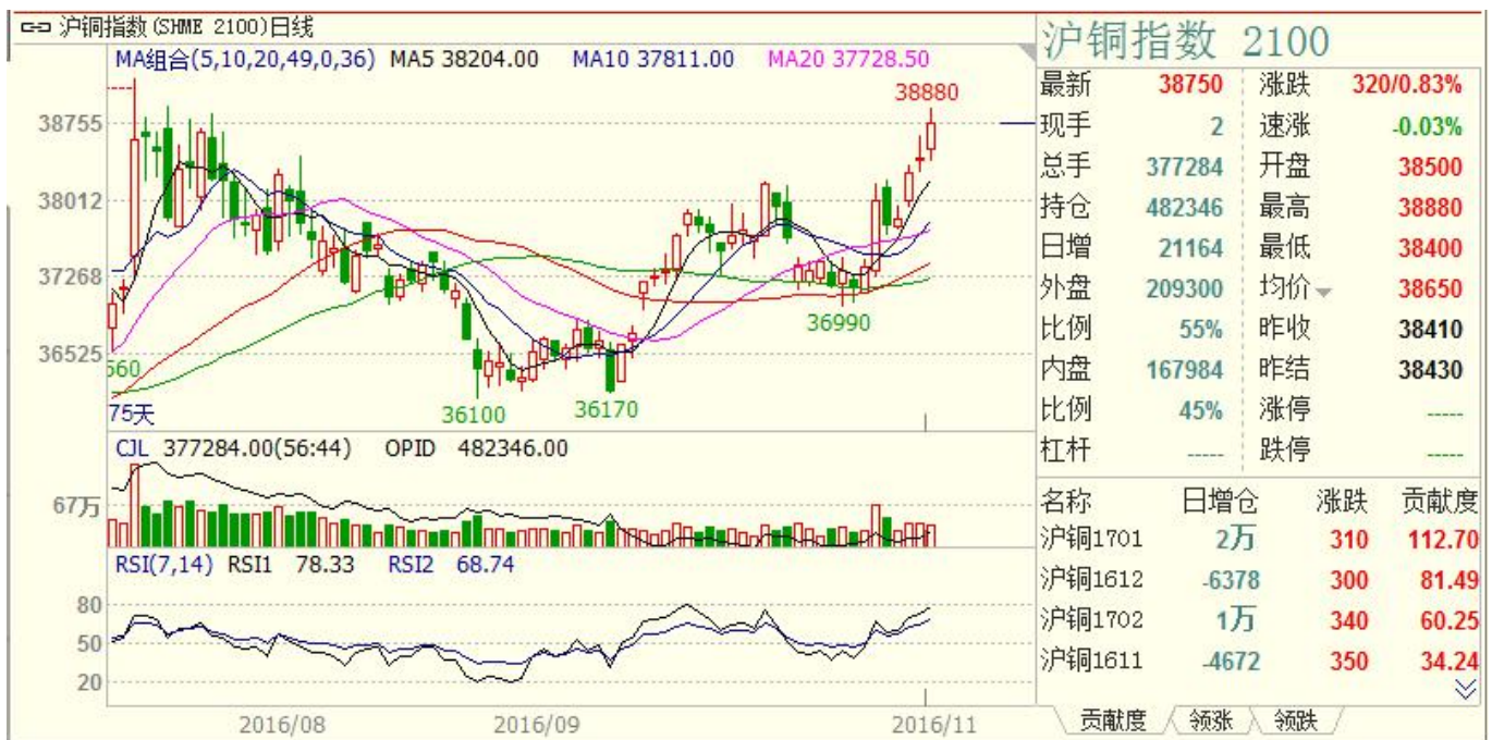
沪铜主力合约日 k 线

技术上看 CMX 铜指周 k 线组合震荡趋强，重心上移，期价在 2.1000 美元/磅有支撑，周均线组合有利于多头，