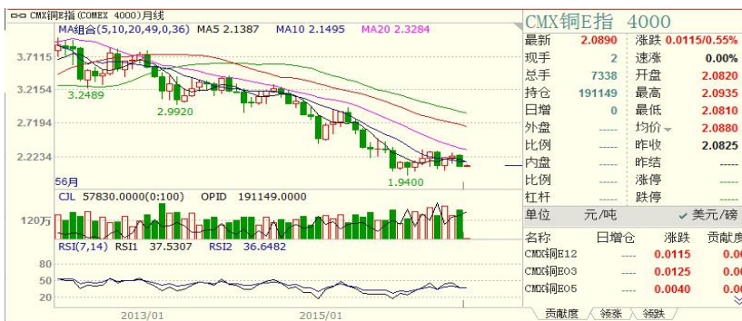
美精铜指数月 k 线

(一) 美精铜指数: CMX 铜指 8 月开盘 2.2405, 最高 2.2515, 最低 2.0720, 收盘 2.0805, 月 k 线为阴线。短期在 2.1600 美元/磅附近有阻力。CMX 铜指 8 月下跌 6.83%。技术面看, 月 RSI14=36.2819 弱势。