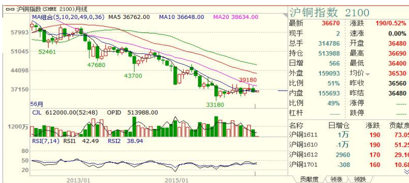
沪铜月 k 线

(二) 沪铜指数: 沪铜指数 8 月下跌 1210 点, 幅度 3.22%, 月 k 线为阴线, 37490 点附近有阻力。8 月开 37620 点, 收盘 36310 点。