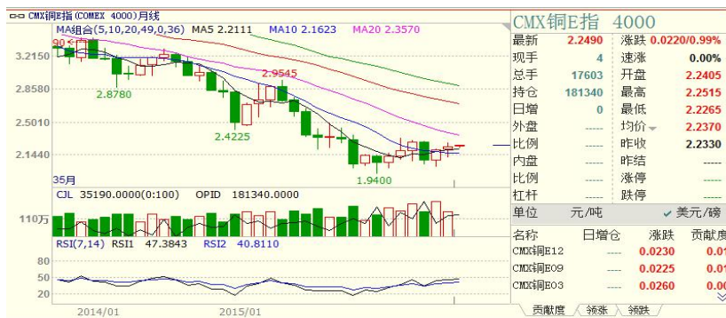
美精铜指数月 k 线

(一) 美精铜指数: CMX 铜指 7 月开盘 2.2045, 最高 2.2760, 最低 2.1205, 收盘 2.2330, 月 k 线为阳线。短期在 2.1600 美元/磅附近有支撑。CMX 铜指 7 月上涨 1.38%。技术面看, 月 RSI14=45.9891 超跌反弹。