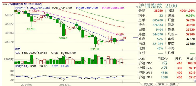
沪铜月 k 线

(二) 沪铜主力合约合约: 沪铜指数 7 月下跌 10 点, 幅度 0.03%, 月 k 线为阳线, 36490 点附近有支撑。7 月开 37440 点, 收盘 37520 点。