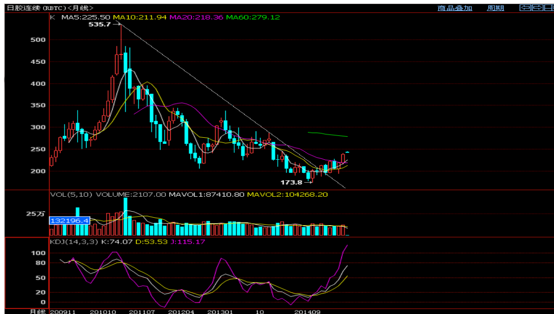
沪胶现货月连续月 K 线图: