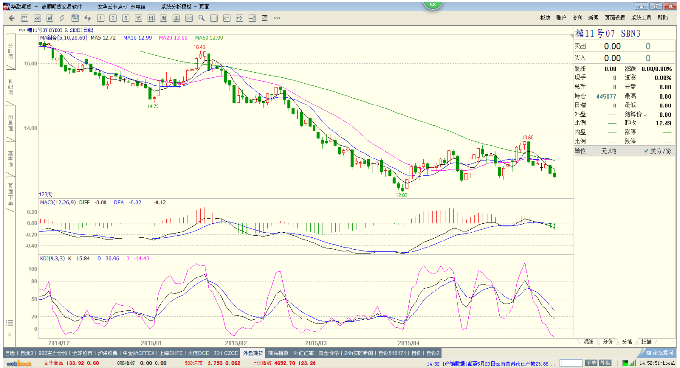
ICE 原糖07合约日 K 线图，图片来源：文华财经

本周受美元走强的影响，大宗商品普跌，原糖承压下行，13 美分失守。后市，美元、原油走势不断干扰期价，加上厄尔尼诺现象发生概率或达到 90%，未来多空因素相互制约，后期关注 13 美分表现情况，未有效突破的情况下，或将延续低位震荡走势。