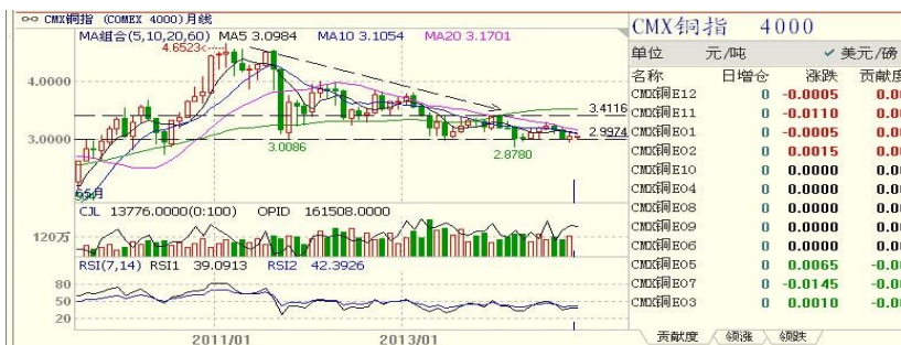
美精铜指数月 k 线

(一) 美精铜指数: CMX 铜指 10 月开盘 3.0075, 最高 3.1090, 最低 2.9515, 收盘 3.0440, 月 k 线为小阳线。短期在 2.8700 美元/磅附近有支撑。CMX 铜指 10 月上涨 1.16%。技术面看, 月 RSI14=42.3926 偏弱, 近期强阻力在 3.1500 美元/磅附近区域。