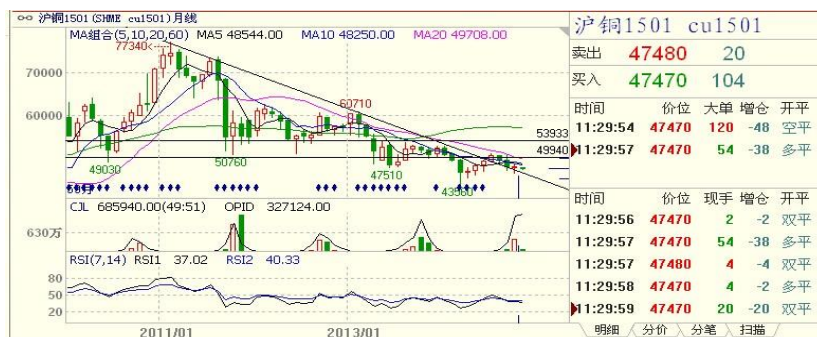
沪铜月 k 线

(二) 沪铜 CU1501 合约: 沪铜 1501 合约 10 月下跌 10 点, 幅度 0.02%, 月 k 线为小阳线, 月均线组合趋弱, 近期 48100 点附近有阻力。10 月开 47690 点, 收盘 47780 点。