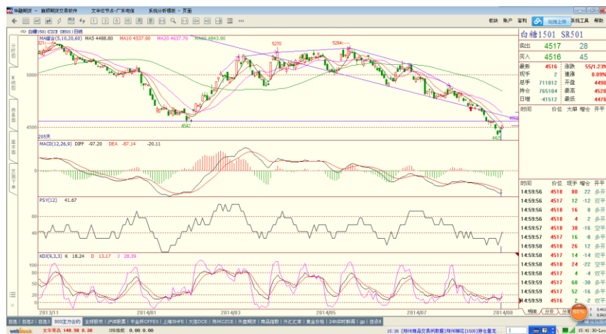
郑糖 1501 合约日 K 线图

本周郑糖继续下探，再创新低。郑糖 1501 合约周五开于 4490 点，最高为 4528 点，最低 4478 点，收盘 4516 点，较上一结算价上涨 55 点，成交量 71 万手，减仓 4 万手，持仓 76 万手。现货报价，周五南宁中间商报价 4370 元/吨，较上周报价下调 80 元/吨，成交一般。