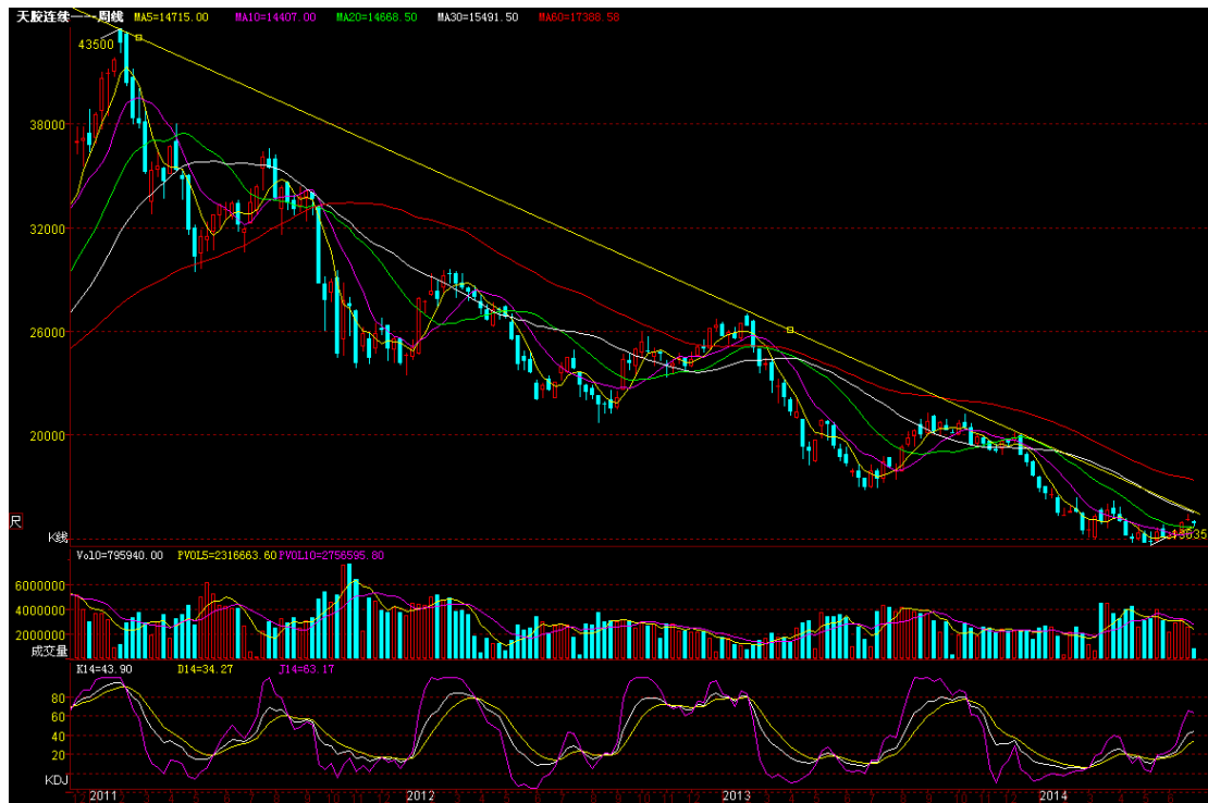
富远行情天胶连续周 K 线图

基于以上的分析，笔者个人认为短期胶价因升幅较大会出现调整走势，但是本轮反弹行情仍未结束，待短期调整构筑头肩底右肩部后期价会继续反弹征途。