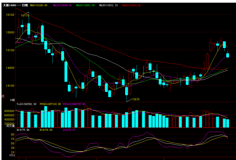
富远行情 1409 月日 K 线图

受国际现货价格企稳、青岛保税区库存降低和技术面等因素支持沪胶本月出现反弹走势。主力1409月合约本月开市14175点，最高15450点，最低13930点，收盘14885点，涨765点，成交量11182234手，持仓量269018手-34214手。