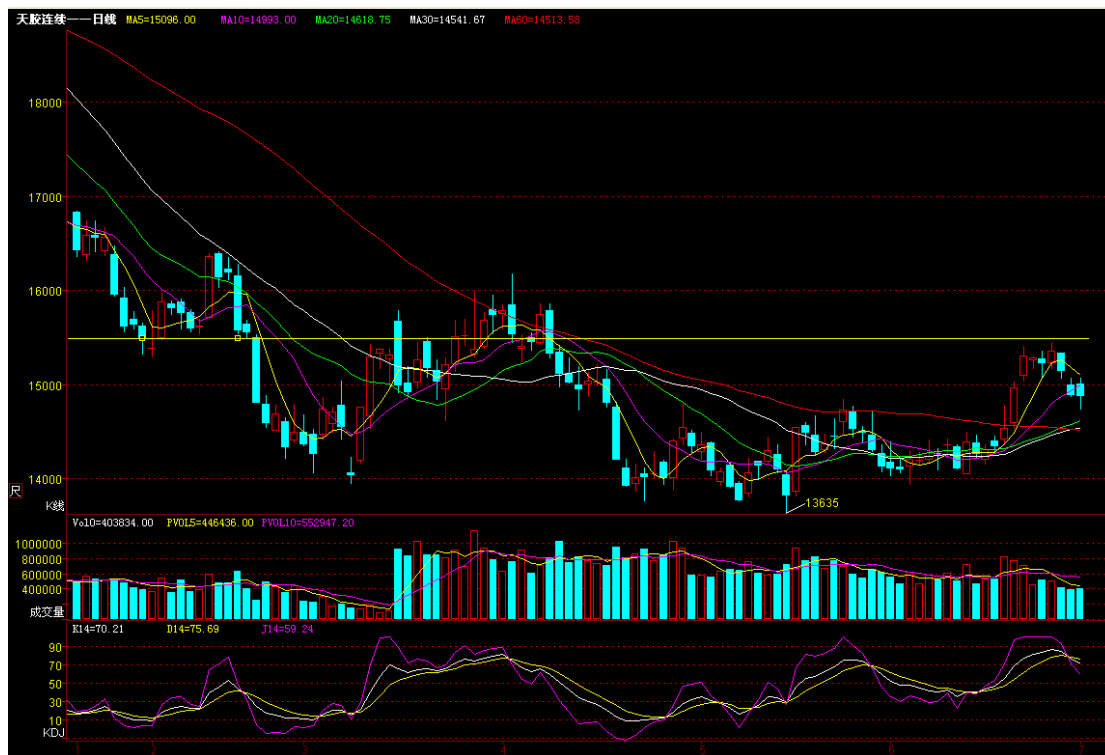
富远行情天胶连续日 K 线图