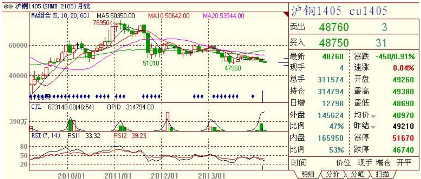
CU1403 月 k 线

技术上看 LMX 铜指在 3.300 美元/磅附近有压力, 短期 3.3000 美元/磅附近阻力较大, 近期 3.3000 美元/磅为短期强弱分界。LMX 铜指月中长期技术指标 RSI=43.5686 弱勢。