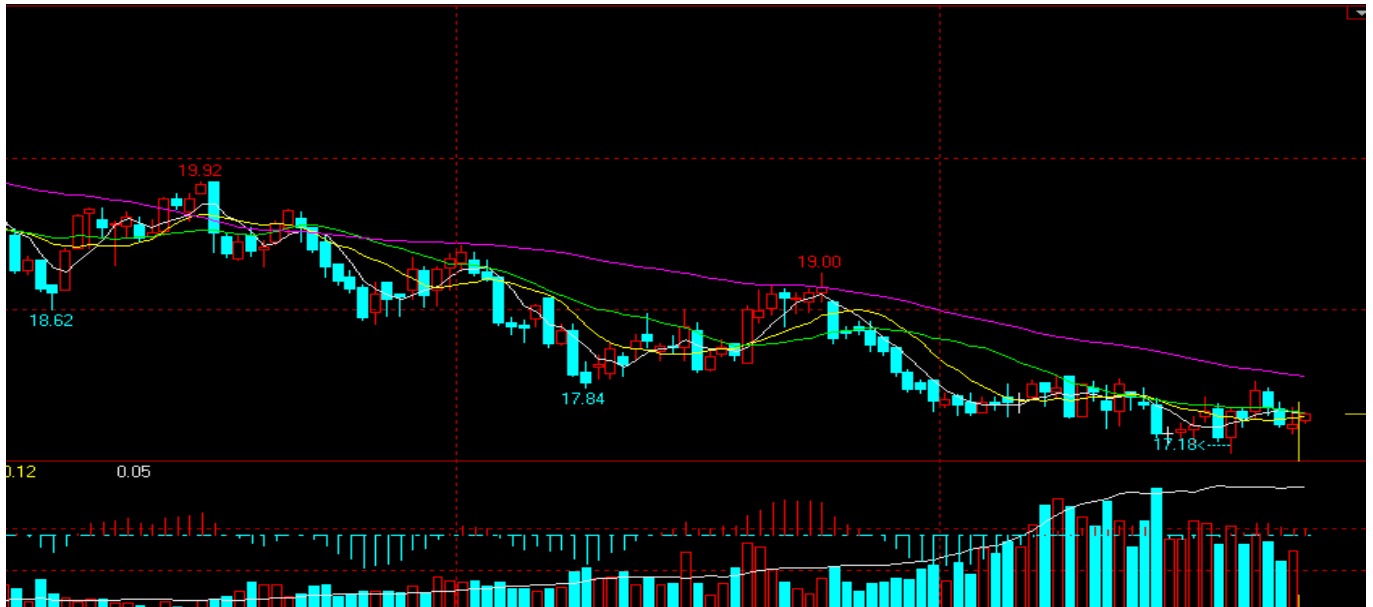
Ice 原糖 1307 合约日线图，图片来源：文华财经

印度产量增加，不断令市场承压，近期点为 17.18 美分/磅，17 美分一线获得支撑。个人认为，下周原糖在没有利好消息提振情况下将维持震荡偏弱走势，阻力位在 17.50-17.60 之间。